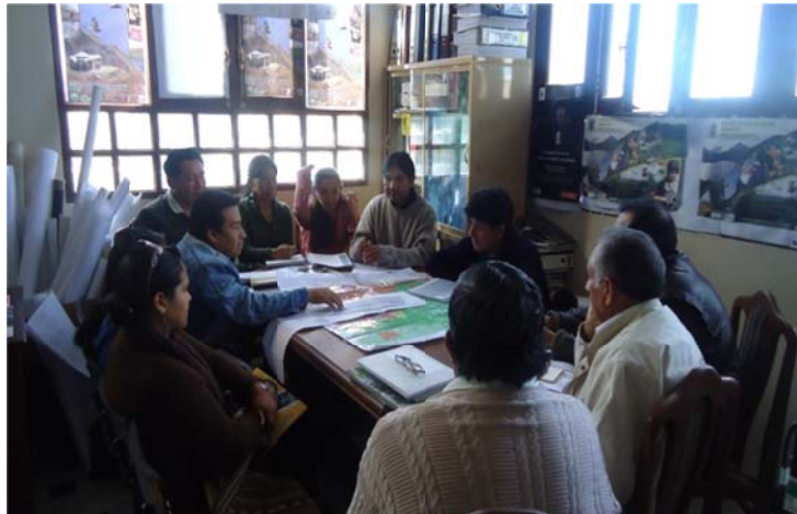
Fig. Nº 5. Reuniones de consenso de la Visión del parque

La formulación inicial de la VISION conceptual para valorizar el contenido y la esencia del parque, fue analizada y consensuada en un taller participativo (cuyo detalle correspondiente se encuentra enunciado en el II informe de la consultoría). La primera instancia de reflexión estuvo referida a la importancia y características que requiere contener una visión generadora de postulados o propósitos, para el efecto, se realizó un breve repaso del diagnóstico levantado sobre la situación actual del parque y del enfoque institucional del GAMT para organizar una intervención planificada y participativa en el parque.