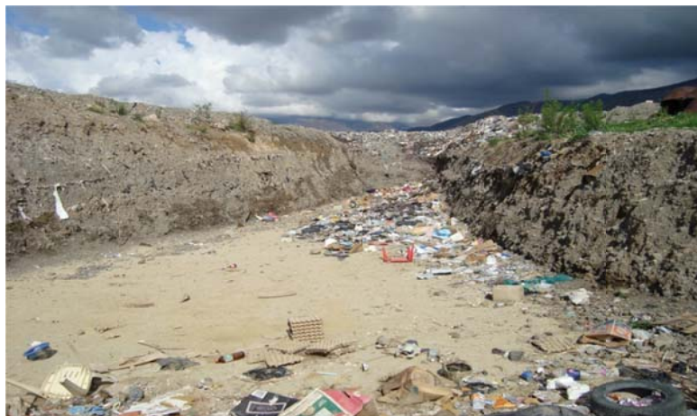
Fig. N° 1. Vertedero municipal

Por las informaciones obtenidas mediante consultas en el diagnóstico participativo, se conoce que el actual sitio donde se depositan los desechos sólidos de la población de Tiquipaya ha sido el resultado de una ocupación de “urgencia”, que en la práctica, de una simple improvisación circunstancial, se afirma con una tendencia peligrosa de ser ampliada. La situación se explica por la demanda del servicio de recojo de basura de una población cada vez más numerosa y de consumo creciente (en las dos últimas décadas).