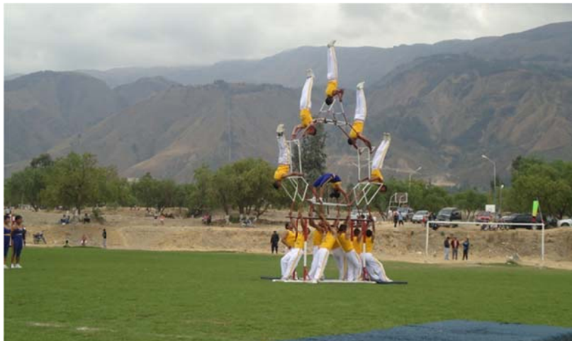
Figura N° 4. Presentación gimnástica militar en el parque