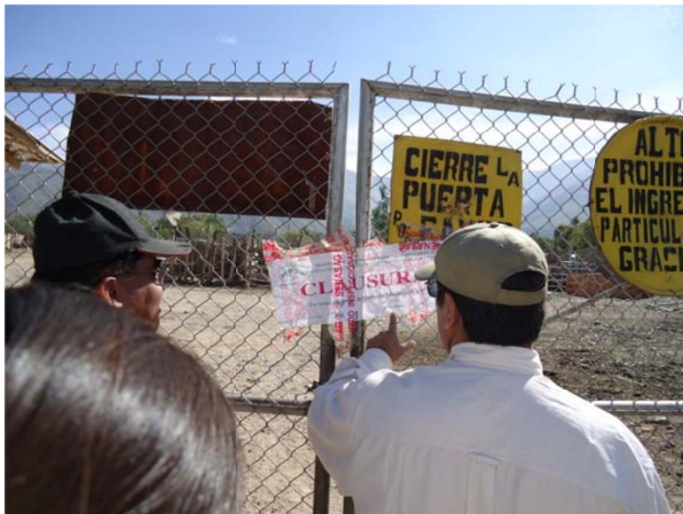
Figura N° 2. Ingreso al Matadero

Las inversiones financieras municipales que se han autorizado son contradictorias a la propuesta institucional de recuperar la función natural del Parque con principios de sustentabilidad y responsabilidad.