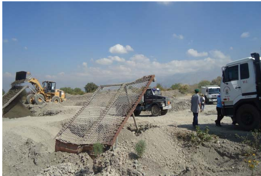
Figura N° 3. Explotación de agregados

Por sus características naturales, estos dos torrentes arrastran materiales pétreos, agregados que luego son recogidos, sin ninguna previsión ni reparo técnico -sistematizado para ser usados en el sector de la construcción. El mal manejo de estas canteras improvisadas contribuye de manera directa al incremento de los riesgos de erosión y deslizamientos por la debilitación de las franjas de seguridad. Adicionalmente a este problema se añade la arbitraria costumbre de algunas personas de realizar depósitos de escombros a lo largo de la ruta de acceso al parque, agudizándose aún más esta problemática.